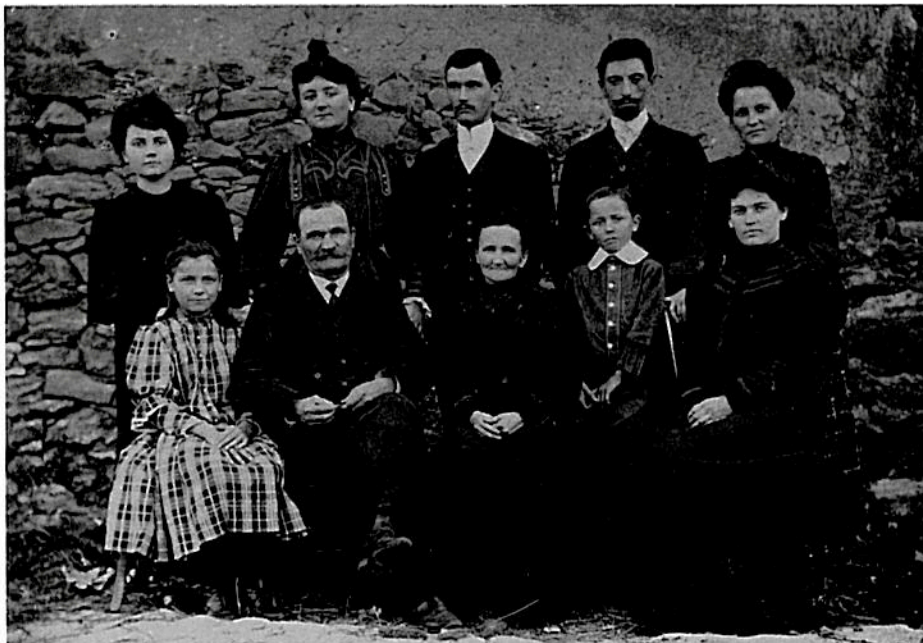
A Lézères en 1905