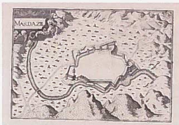
Plan 2 du Mas d'Azil à l'époque du siège